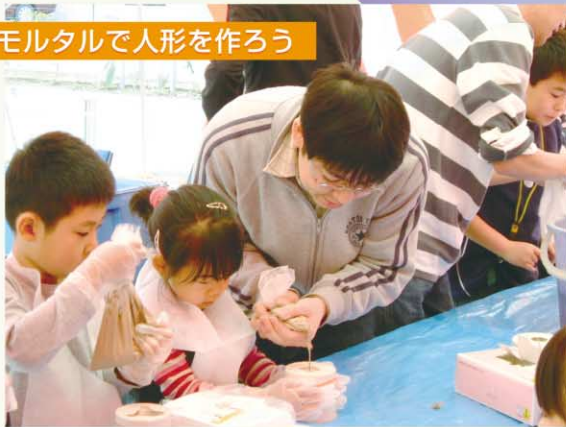
モルタルで人形を作ろう