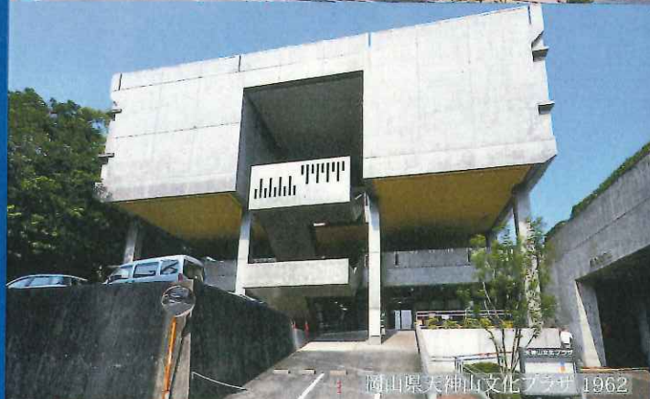
岡山県天神山文化プラザ 1962