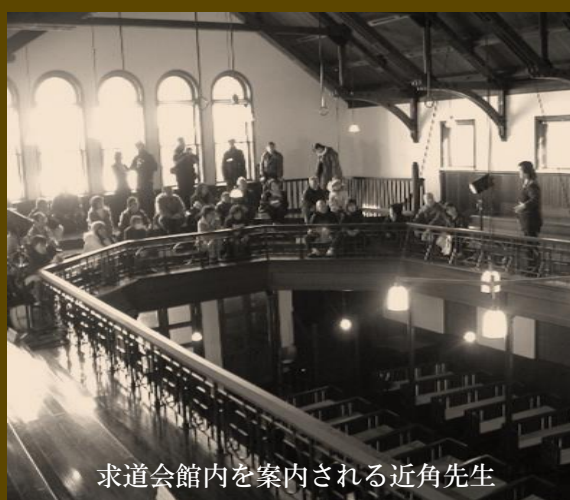
求道会館内を案内される近角先生