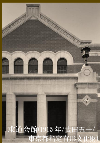
求道会館 (1915 年 / 武田五一 / 東京都指定有形文化財)