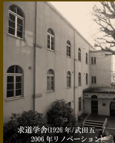
求道学舎 (1926 年 / 武田五一 / 2006 年リノベーション)

主催：(一社)日本建築学会中国支部山口支所 共催：山口県 山口県議会 NPO 法人まちのよそおいネットワーク 山口近代建築研究会 (一社)山口県建築士会 [CPD 対象事業/2 単位] 後援：(一社)山口県建築士事務所協会 (公社)日本建築家協会中国支部山口地域会