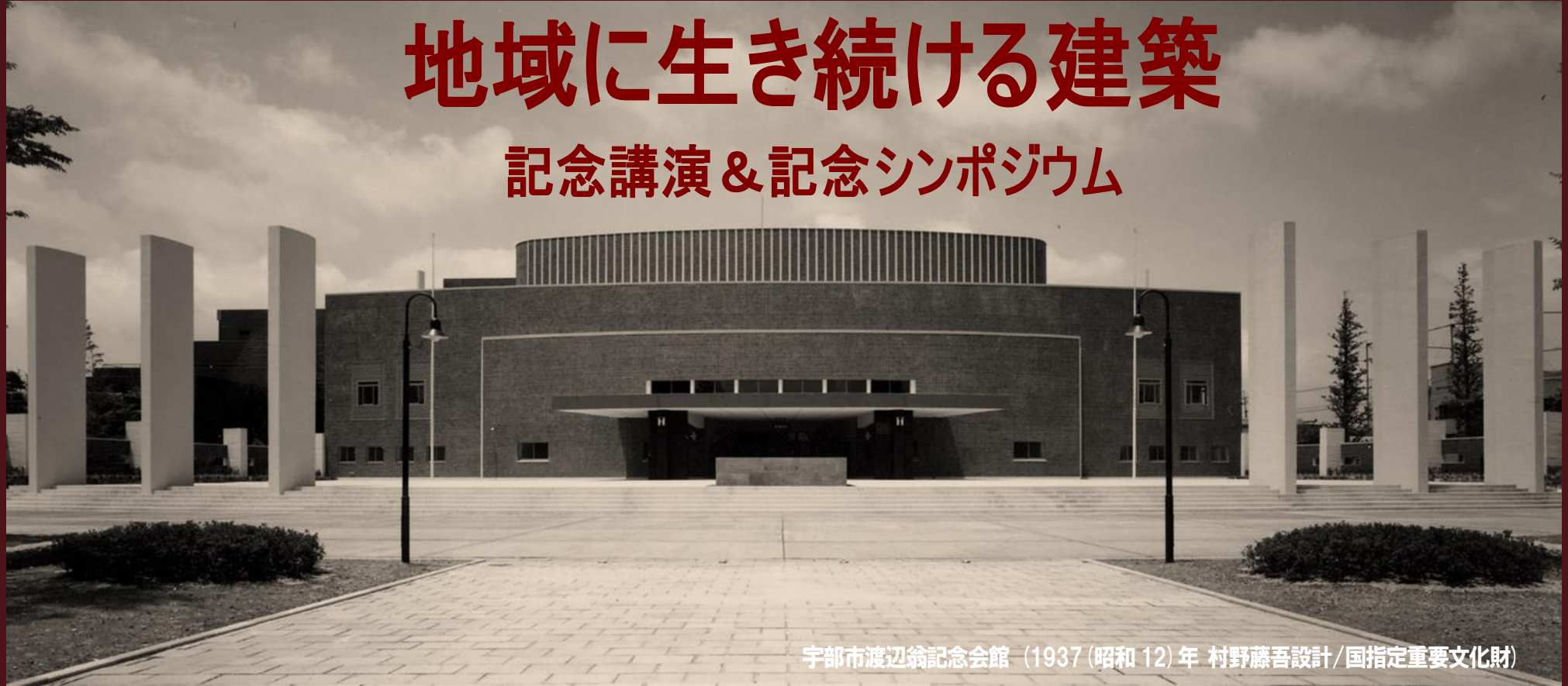
宇部市渡辺翁記念会館 (1937 (昭和 12) 年 村野藤吾設計/国指定重要文化財)

日時:平成 29 年 9 月 16 日 (土) 14:00~18:00 場所:宇部市渡辺翁記念会館1階大ホール 主催:日本建築学会中国支部山口支所