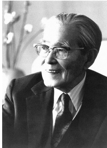
建築家 浦辺鎮太郎

倉敷のデュドクになってやろうと考えたんだ。ヒルバーサムという当時人口5万くらいの町の市役所に勤めてね、そして建築家となってその町の大事なものはほとんど一人でみんなやっちゃった。(中略)ぼくの卒業設計を見てもデュドクばかりですよ。