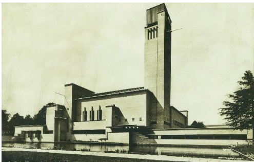
ヒルバーサム市庁舎(1931年) (ウィレム・マリヌス・デュドク)

※ 上記の文章はすべて「浦辺鎮太郎作品集」(2003年・新建築社発売)より転記しました。