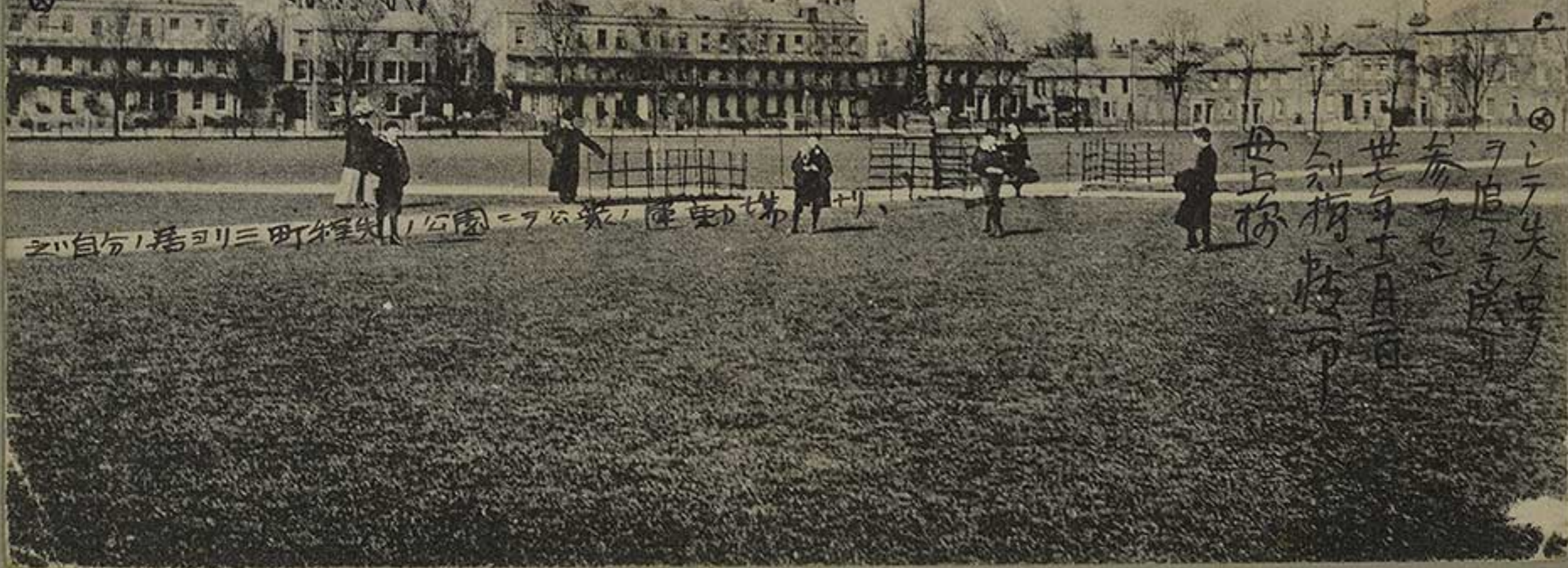
公園 = 公共の運動場 三町三三、居り、自分

世に年有昔祖母上の みまのうらやましくしとゆきて りまきま、代りてく、四曲 (一) あつしひらばは声の何ふ こころのしるものそのはじめ 都よのふとまゝあつし 其みまをかたあつし 其片物のあつし (二) ちりしむあつし枝子の 句といたくめく シカワケ 接物ませし 其片物のあつし 其片物のあつし (三) 庭の白菊咲き 秋の初ははのあつし 秋葉とあつし 其片物のあつし 其片物のあつし (四) 長への眠の園 ねむとみんさ さめぬ眠と 路がど置添の 庭の夜も 四上、見玉 ひげれい 九葉三 長、賀前