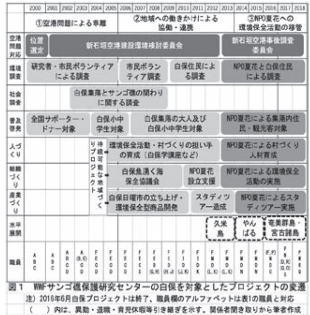
図 1 WWF サンゴ礁保護研究センターの白保を対象としたプロジェクトの変遷 注) 2016年6月白保プロジェクトは終了、職員欄のアルファベットは表1の職員と対応 ( ) 内は、異動・退職・育児休暇等引き継ぎを示す。関係者聞き取りから筆者作成

変遷(図1)と歴代職員の勤務期間、担当業務、出身をまとめた(表3)。19名の職員の内、在職中白保に居住した者は16名で、1名は大浜集落、2名は市街地に居住した。