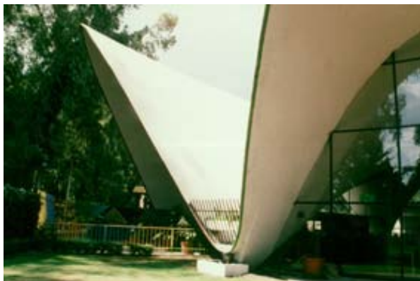
図2 4cmのシェル厚は、足元で12cmに補強されている