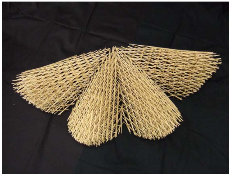
図1 型枠のためのフレーム模型

ソチミルコのレストランは自他ともに認めるキャンデラの最高傑作。 メキシコシティから南へ23km。舟遊びで有名なソチミルコ（花畑）の水辺にたつ。 プランは900平方メートルの正方形で、シンメトリーな4つの鞍型交差シェルの相貫によって構成されている。スパンは30メートル、中心部分から跳ね出し部分までは約21メートル、シェルの厚みはV字型の足元の部分では12センチに補強されている。膜応力だけで構造を成立させるフリー・エッジのシェルは、キャンデラのひとつの到達点であり、優雅さ、軽快感を強調している。