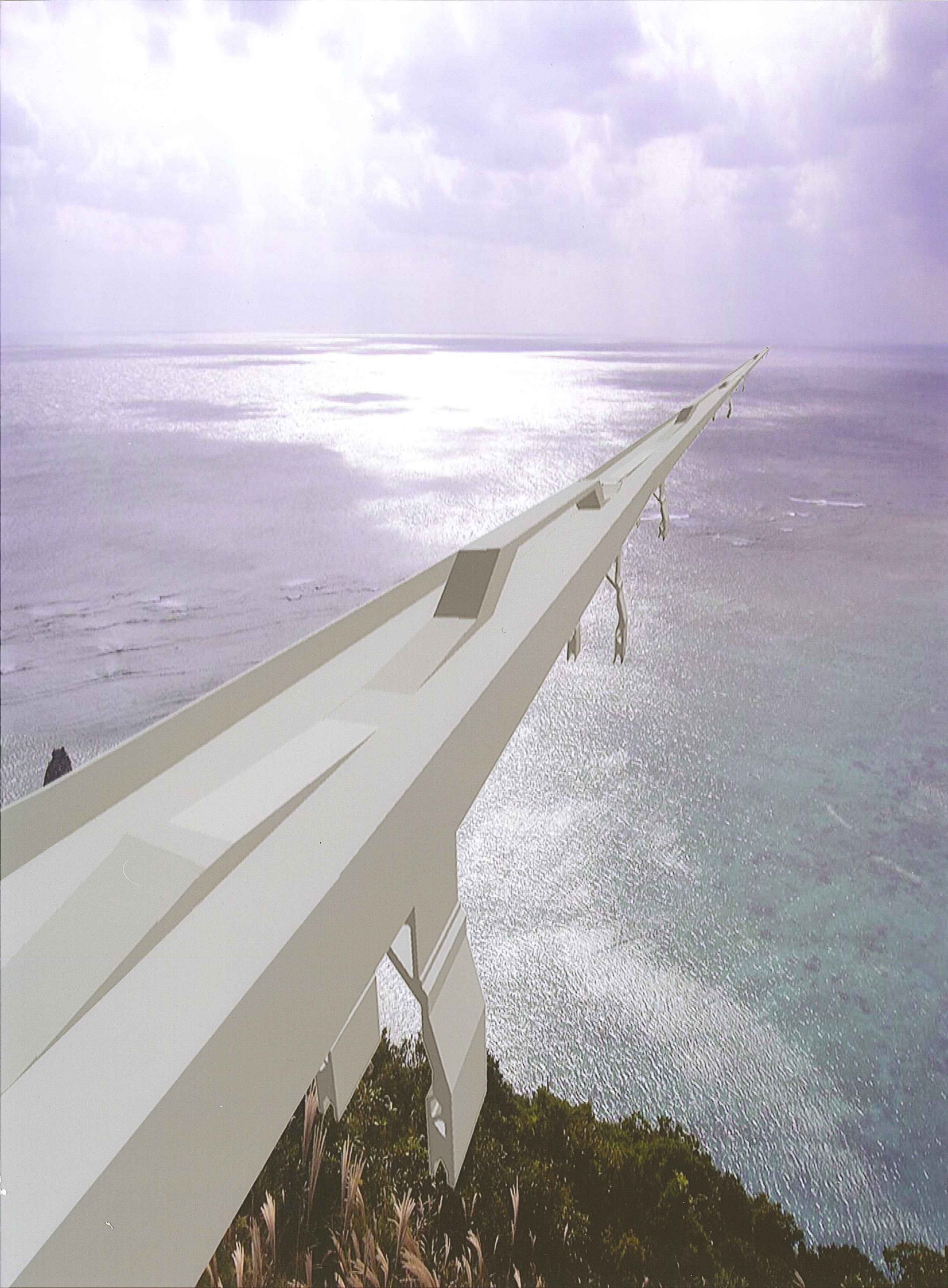
橋梁ダイアグラム