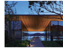
山と星空の湯布院