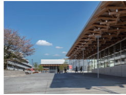
大分県立芸術文化短期大学 キャンパス再整備(第一期)

石原健也・西田司・一色ヒロタカ・徳淵正毅 デネフェス・オンデザイン設計共同体/オーヴ・アラップ・アンド・パートナーズ・ジャパン・リミテッド 大分県大分市