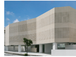
ZIG-ZAG HOUSE/ 屏風の家