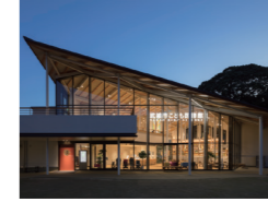
武雄市こども図書館