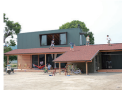
下屋根のスタジアム