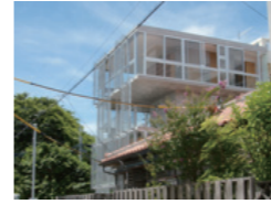
センターコアの住宅