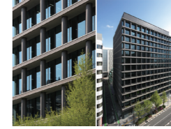
紙と博多中央ビル