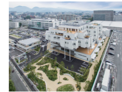
大腸肛門病センター高野病院