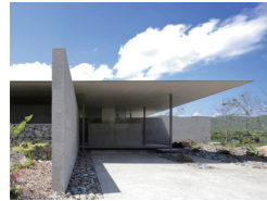
父母の家 松山将勝 松山建築設計室