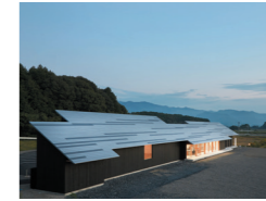
にしき ひみつ基地ミュージアム