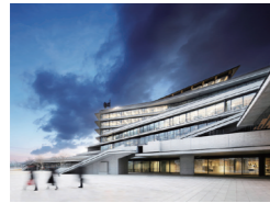
長崎県庁舎 山梨知彦・高橋央・平井友介 (株)日建設計