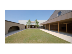
認定こども園和泉幼稚園