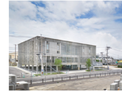
株式会社技建新本社ビル