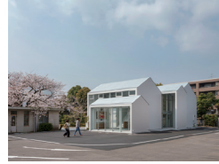
長崎大学医学部ゲストハウス レジデンスー精得館 佐々木翔・佐々木信明 (株)INTERMEDIA