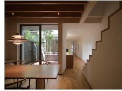
川尻の町家 柳瀬真澄 柳瀬真澄建築設計工房