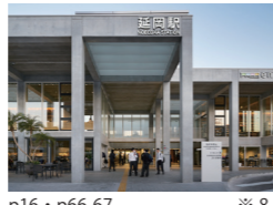
延岡市駅周辺整備プロジェクト