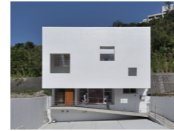
タテのアマハジで繋がる家