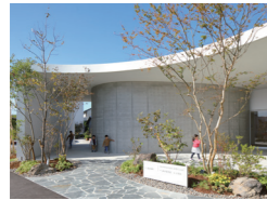
お倉が浜 kids クリニック 松山将勝 松山建築設計室