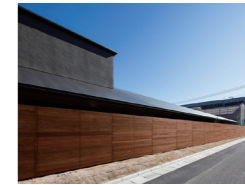
看護小規模多機能 cocoro の となり/訪問看護ステーション cocoro