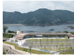
五ヶ山クロス ベース 平瀬有人・平瀬祐子 佐賀大学・yHa architects/yHa architects