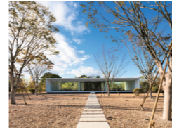
パスカル大分事務棟