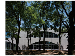
九州大学デザインコモン 田上健一・小林弘和 九州大学/九州大学施設部