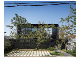
森と空へ 岸本和彦 acaa