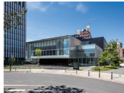
福岡県弁護士会館