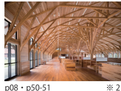
屋久島町庁舎 三井所清典・大倉靖彦・武田光史・小口亮・初井玲 アルセッド建築研究所