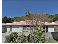
慶良間の家 濱元宏・豊崎孟史 (株)GAB