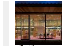
豊後高田市立図書館 益子一彦 (株)三上建築事務所