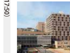
熊本大学臨床研究棟 庄崎宏治・福田哲也・河合正理 (株)久米設計