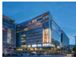
KITTE 博多 黒木正郎・竹本勉・武田雅志・南宗男・ 待井寿顕 日本郵政(株)一級建築士事務所 / (株)三菱地所設計