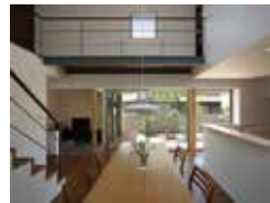
福重の家 柳瀬真澄 柳瀬真澄建築設計工房