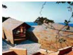
海に見える休憩所 杉野友紀 南杉野建築設計事務所

(株)醇建築まちづくり研究所 / (株)坂倉建築研究所 / 積水ハウス(株) / (株)坂倉建築研究所(株) / メイ建築研究所 福岡県福岡市