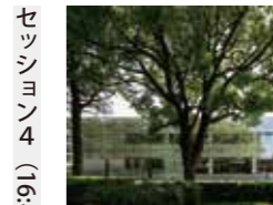
熊本大学附属図書館 中央館 益子一彦 (株)三上建築事務所