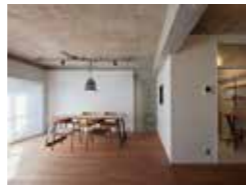
鴨池新町の設い 有吉弘輔 ノットイコール一級建築士事務所