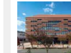
西南学院大学図書館 飛永直樹・篠原正樹 (株)佐藤総合計画