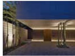
MP-house 西濱浩次 コンパス設計工房