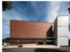
出光美術館 (門司) 津嶋功・小林信策・小松剛之 (株)岡田新一設計事務所