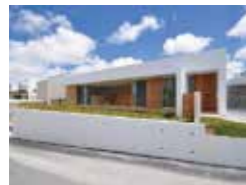
南間口に開く家 金城司 南門一級建築事務所