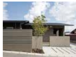
鞘ヶ谷の家 柳瀬真澄 柳瀬真澄建築設計工房