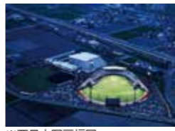
HAWKS ベースボールパーク筑後 川野久雄・武市章平 大成建設(株)