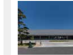
福岡病院中央棟 笹栗久幸・平山雅司・西朋子・ 西村章・松竹勲臣・井上雄二・ 藤田勝道 (株)竹中工務店