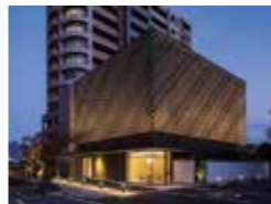
永照寺 納骨堂 (歸命殿) 鮎川透・杉本泰志・倉掛健寛・ 柴田陽平 (株)環・設計工房