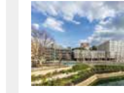
長崎みなとメディカルセンター 高橋創・富沢照秋・小川寛之・ 松村正人・三橋啓史・佐々木直大・ 岩崎篤・坂本守・池田剛 (株)久米設計 / 大成建設(株) / (株)松林建築設計事務所 / (株)TID 設計 長崎県長崎市