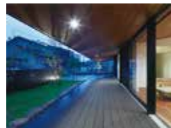
城台の家 江藤健太 江藤健太アトリエ建築設計事務所