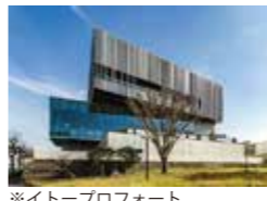
熊本県民テレビ新社屋プロジェクト 青柳武宣・松井健太郎・大迫公生・ 太田俊也・酒寄弘和・岩間寛彦・ 吉瀬維昭・宮西紀彰・野嶋敏 (株)三菱地所設計 熊本県熊本市