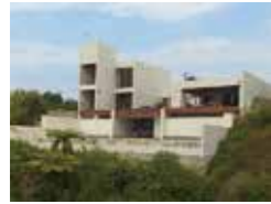
森の棲家 金城豊 南門一級建築事務所