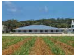
北大東村複合型福祉施設 伊東まこと・大阪歩 一級建築士事務所 tin architects