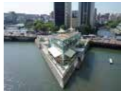
SHIP'S GARDEN 松岡恭子・井手健一郎・高島宗一郎・ 倉富純男・松本優三 (株)スピングラス・アーキテクト / (株)リズムデザイン 福岡市 / 西日本鉄道(株) / (株)松本組 福岡県福岡市