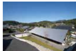
大屋根の棲家 松山将勝 松山建築設計室