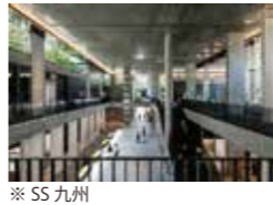
なみきスクエア 安田俊也・赤澤大介・有山英伸 (株)山下設計