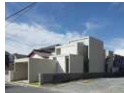
loophole 西岡梨夏 ソルト建築設計事務所