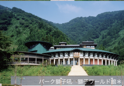
パーク獅子吼・獅子ワールド館*