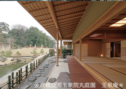
金沢城公園玉泉院丸庭園 玉泉庵*