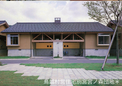
鳥越村宮住宅別宮宮ノ森団地*