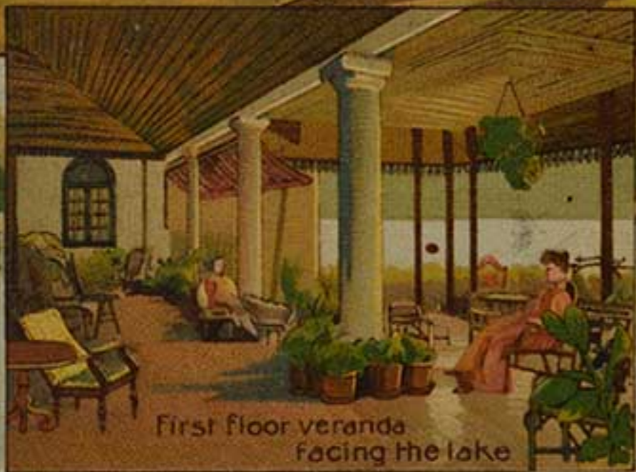
First floor veranda facing the lake