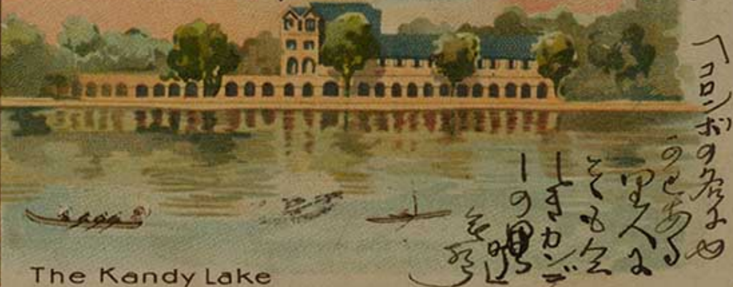
The Kandy Lake