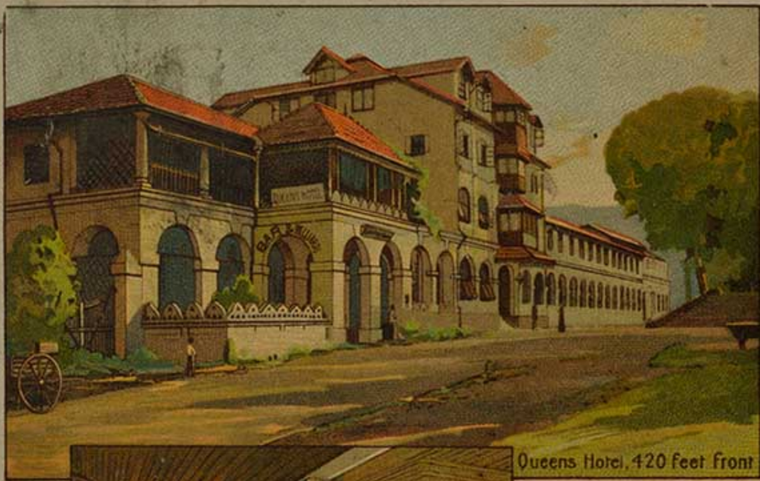
Queens Hotel, 420 Feet front