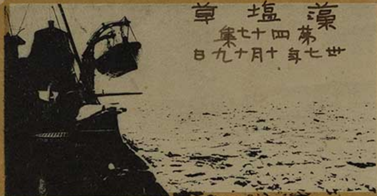
船艦我ノ中米派江拍大

此一兩日ハ当地モ甚ク暖 気ニテ一度焚キ急ケタ煖 快ニ又止ソタ程ナル日 本晴。紅葉狩ト思出 サル際東半島ノ時ナリ 紅葉今果シテ如何