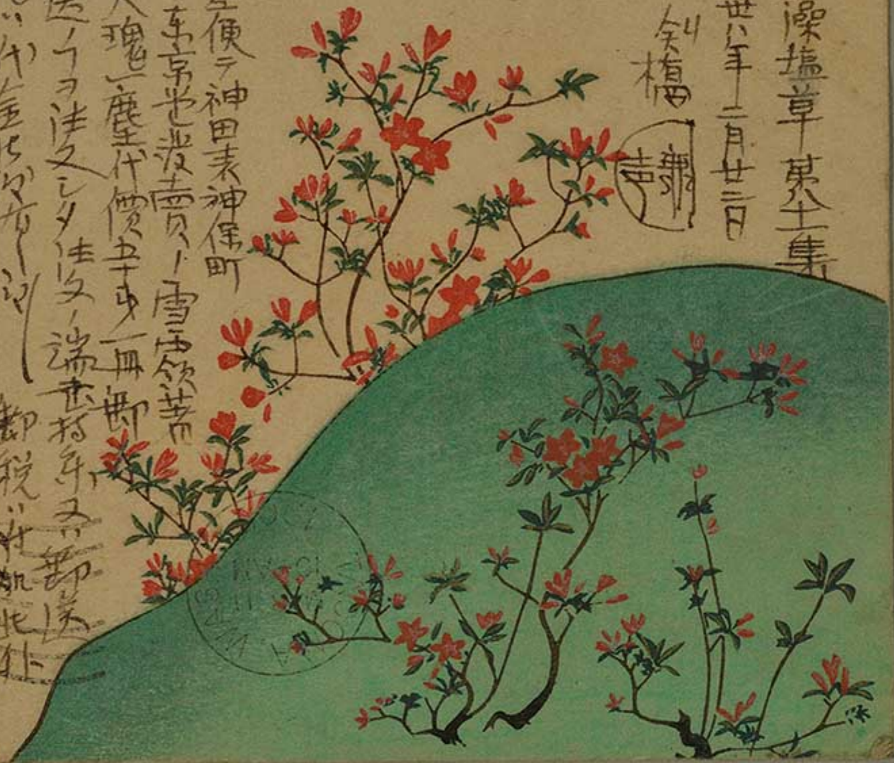
From a painting by Kōrin.